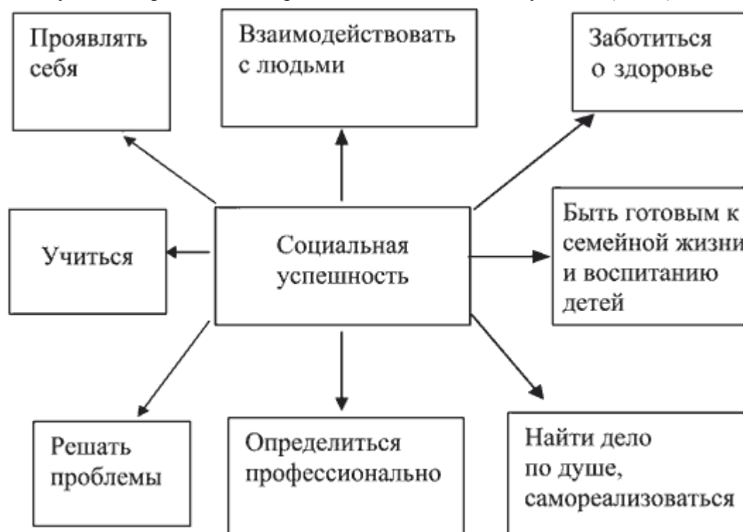
Рис. 2. Умения, обеспечивающие социальную успешность

Достижение успеха определяется обретением целой системы умений (Рис.2):