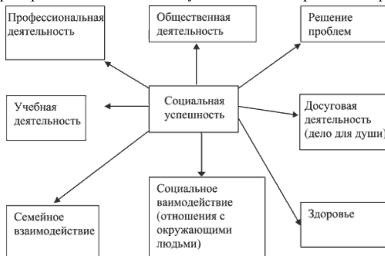
Рис. 1. Сферы проявления социальной успешности личности

Описанные сферы проявления социальной успешности изображены на рис. 1.