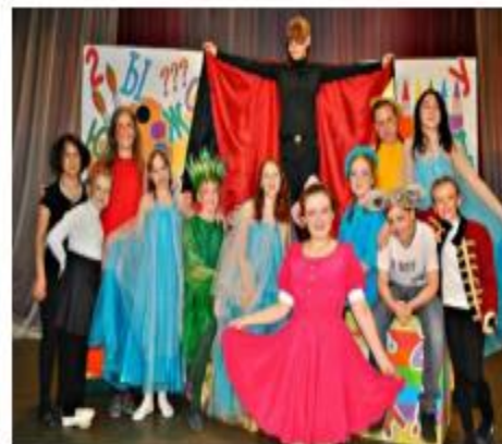
Школа № 2 г. Нытва активный участник краевых конкурсов