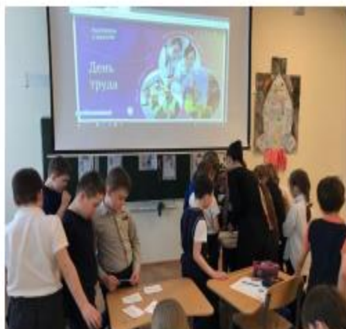
Школа № 42, г. Пермь родители знакомят детей с профессиями

100 % обучающихся охвачены разговорами о важном