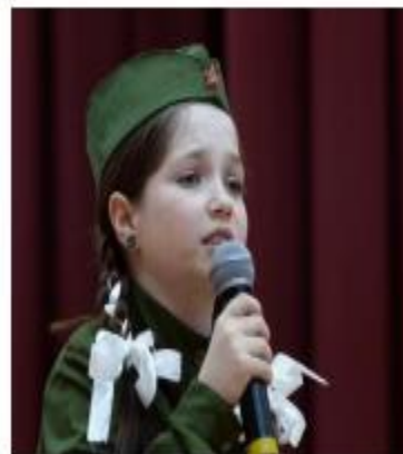
Школа № 3 г. Лысьва Лауреат Всероссийского конкурса «Малахитовая шкатулка»