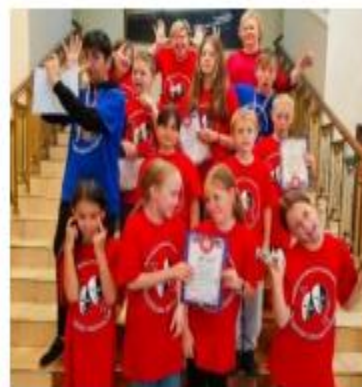
Фроловская школа 3 место во Всероссийском конкурсе «Театральная юность России»