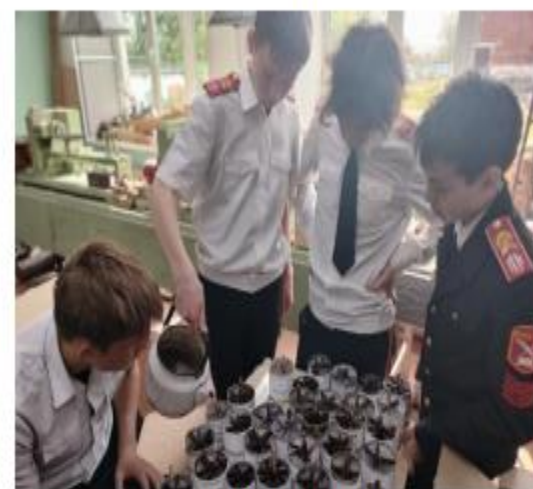
Кадетская школа, г. Чернушка