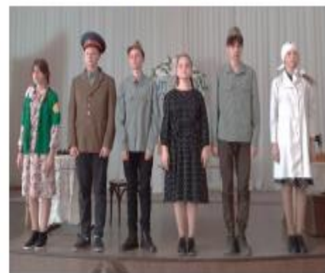
Школа № 83 г. Пермь специальный диплом на открытом форуме "Серебряный софит"