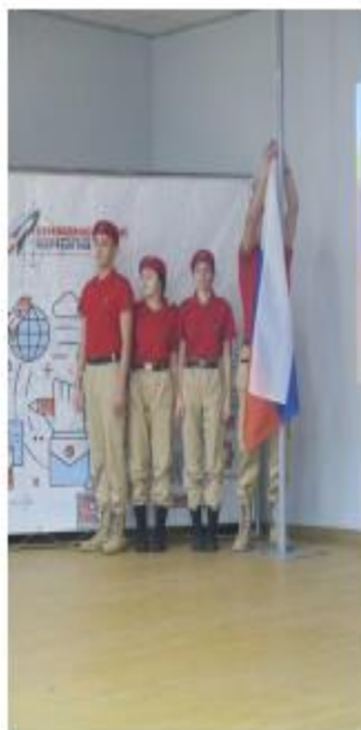
Инженерная школа, г. Пермь