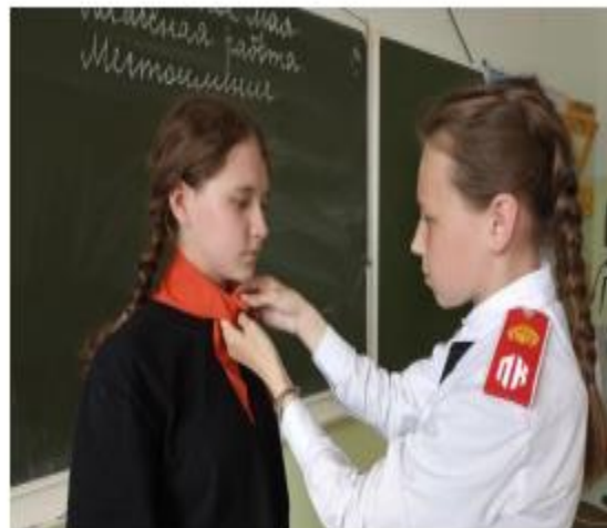
Кадетская школа имени Героя Советского Союза Е.И. Францева, Чернушинский округ, посвящение в Орлята России