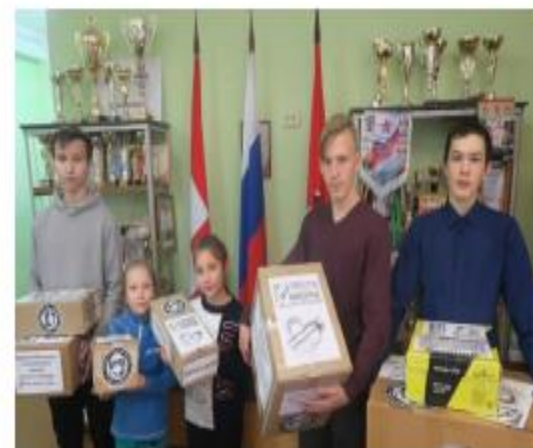
Инженерная школа, г. Пермь