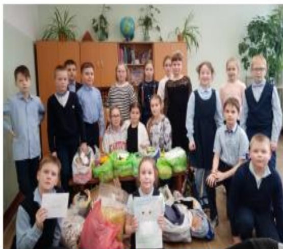
Школа № 2 имени М. Горького, г. Березники