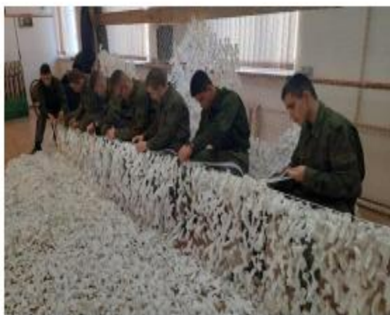
Новоильинский казачий кадетский корпус имени Атамана Ермака, Нытвенский округ