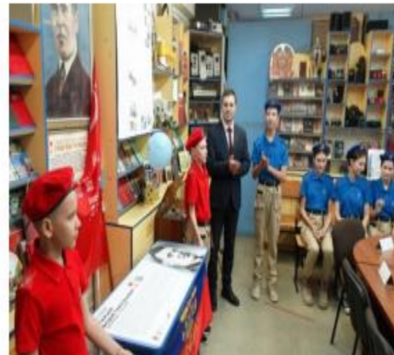
Всероссийский образовательный проект «Парта Героя»