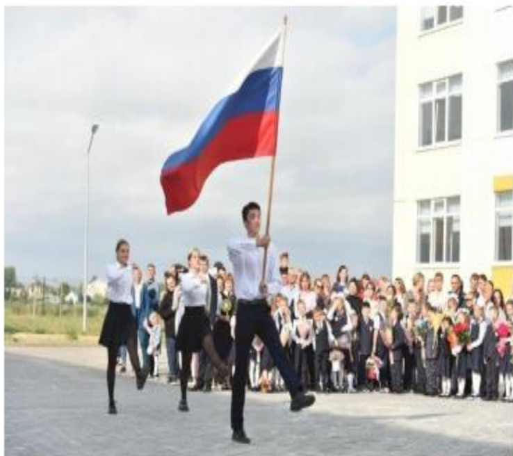
Конзаводская школа им. В.К. Блюхера, Пермский округ