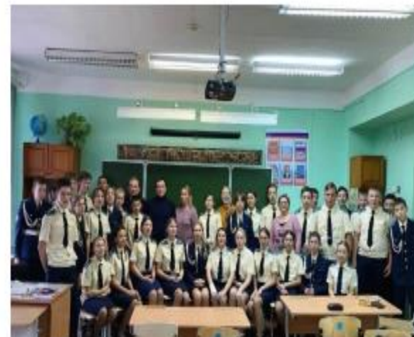
Добрянская школа № 1 (Кадетская школа), встреча с участником СВО